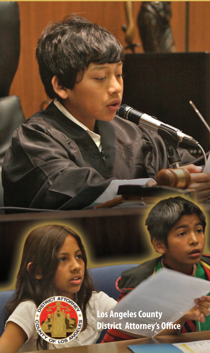
Los Angeles County District Attorney's Office

Each fall, the District Attorney's Office encourages its attorneys, investigators and other professional staff to take time out of their busy schedules to volunteer one hour a week to teach fifth-graders about the criminal justice system.